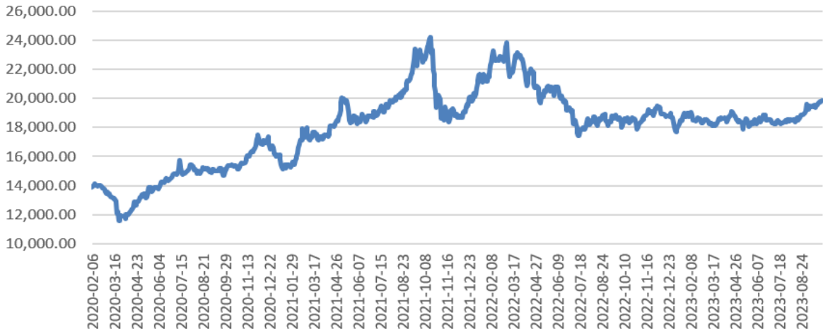
2020年-2023年9月的铝锭含税价格（元/吨）

报告期内，发行人主要采购的原材料为铝锭，发行人与主要供应商约定的铝锭采购价均以长江有色金属网或上海有色金属网公布的铝锭现货中间价为基础+运杂费确定，运杂费占比极小，因此，发行人向各主要供应商采购的铝锭价格与铝锭现货中间价高度接近，不存在较大差异情形。