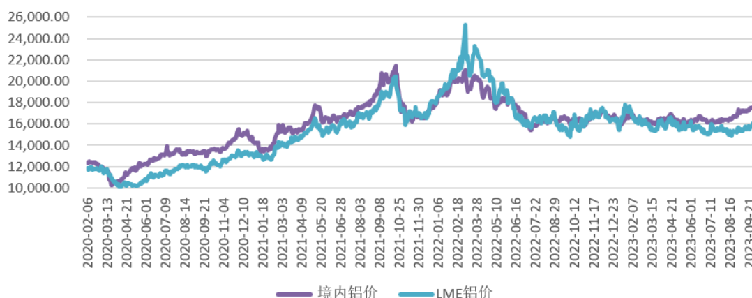
2020年-2023年9月境内铝价与LME铝价波动趋势（元/吨）

发行人主要定价方式为“基准铝价+加工费”，这种定价方式是铝加工行业销售定价的普遍形式。发行人2020年和2021年的境外毛利率低于境内毛利率，主要原因系发行人2020年和2021年的外销定价的基准铝价为伦敦金属交易所（LME）铝价，同期采购铝锭的基准铝价为上海有色金属网或长江有色金属网的价格，由于伦敦金属交易所（LME）铝价低于同期境内长江有色金属网和上海有色金属网铝价，导致发行人境外毛利率较低。