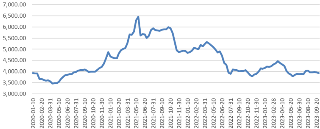
热轧普通板卷价格（元/吨）